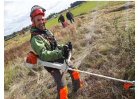
Der Lehrgang zum Geprüften Natur- und Landschaftspfleger/zur Geprüften Natur- und Landschaftspflegerin startet im September 2024.